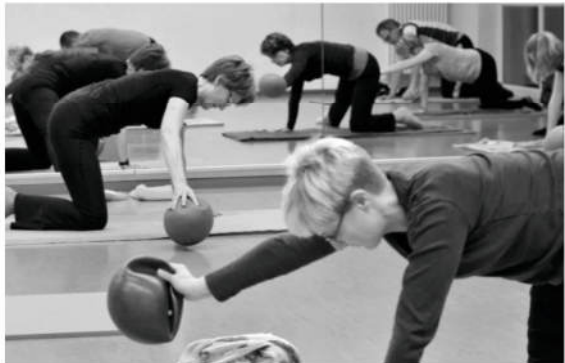
Übungen mit dem Pilates-Ball im Vereinsheim